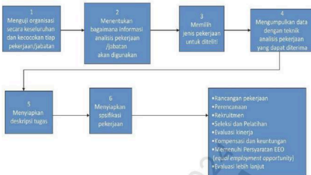
Gambar 4.2 Proses Analisis Jabatan Pekerjaan