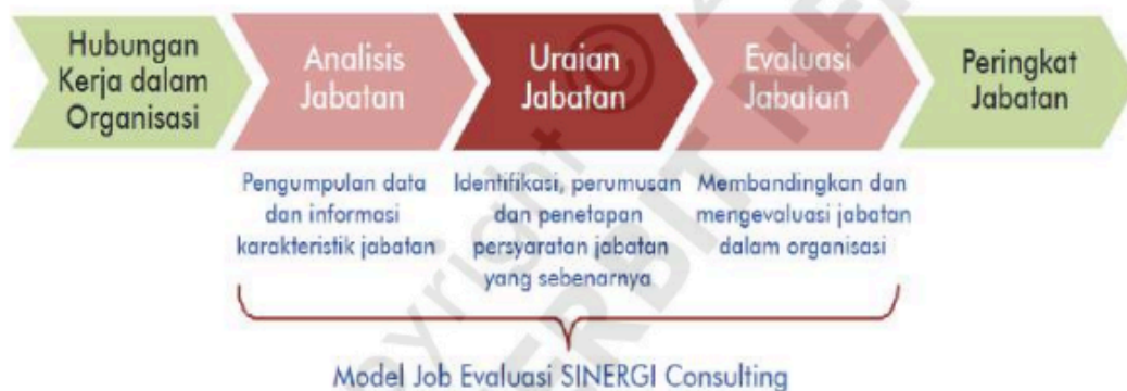
Gambar 4.3 Proses Analisis Jabatan Organisasi