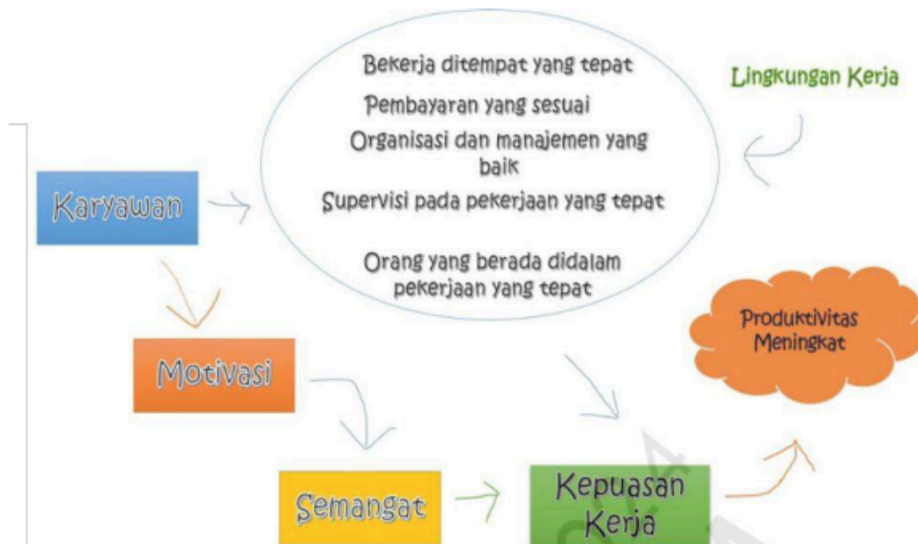
Gambar 9.1 Hubungan Kepuasan Kerja dengan Faktor Lainnya

Pembahasan mengenai kepuasan kerja dalam Psikologi Industri dan Organisasi, menentukan sasaran atau target spesifik sangat penting untuk mengarahkan tujuan pembahasan dan menentukan hasil yang diharapkan. Berikut adalah sasaran yang ingin dicapai dalam pembahasan kepuasan kerja.