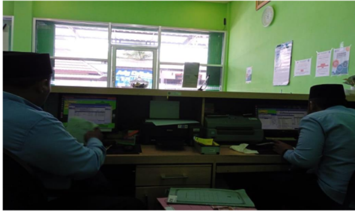
Gambar 5 : Penutupan sistem operasional di Kantor BMT UGT Nusantara Wonokerto

Tahap selanjutnya adalah tahapan yang paling akhir dalam pelaksanaan pengabdian masyarakat ini yakni mengolah data yang didapat selama kegiatan untuk kemudian mengkaji masalah di lapangan sesuai bidang keilmuan. Berdasarkan hasil observasi yang telah disampaikan di atas, salah satu produk pembiayaan yang ditawarkan oleh BMT UGT Nusantara Wonokerto kepada nasabah anggota dan banyak dipilih saat hendak mengajukan pembiayaan ialah PJE (Pembiayaan Jaminan Emas). Pembiayaan jenis ini menggunakan akad rahn yang mana dalam praktiknya pihak penggadai (rahin) akan menyerahkan objek gadai (marhun) sebagai jaminan atas pembiayaan tersebut.