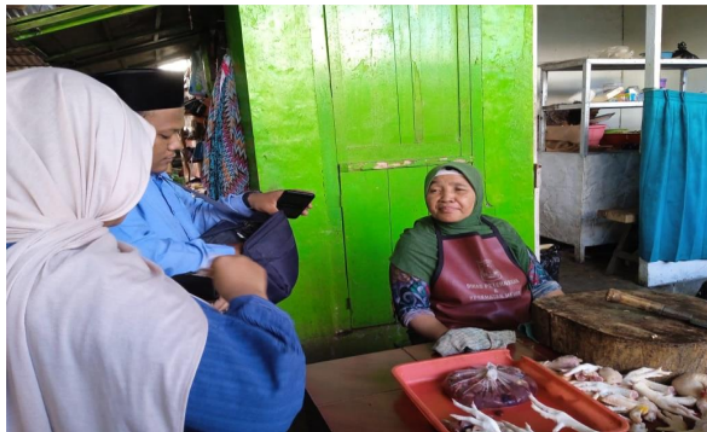
Gambar 4 : kegiatan di lapangan bersama dengan nasabah / masyarakat yang menjadi pelanggan BMT UGT Nusantara Wonokerto

Aktifitas selanjutnya adalah kegiatan penutup yang diakhiri dengan penutupan transaksi sistem operasional yang dilakukan oleh admin kasir kantor BMT UGT Nusantara Wonokerto