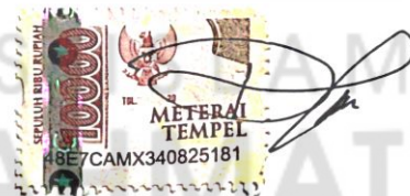
Dimas Bagus Satria