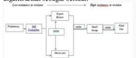
Gambar 3. 1 Alur Desain Formative Evaluation (Tessmer,1993 dalam Zulkardi,2002:22)

Jenis metode yang digunakan dalam penelitian ini adalah jenis penelitian pengembangan ( Research and Development ). Model pengembangan yang digunakan adalah model pengembangan tipe formative research Tessmer (1993) dalam Martina(2017: 42). Adapun tahap-tahap penelitian Research and Development menurut Tessmer dapat digambarkan sebagai berikut: