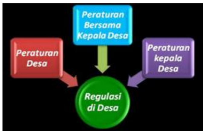
Gambar 2. Regulasi di Desa (Permendagri nomor 111 tahun 2014)

Pasal 69 Undang-Undang Desa menjelaskan, regulasi di Desa meliputi: Peraturan Desa, Peraturan Bersama Kepala Desa dan Peraturan Kepala Desa. Dan peraturan- peraturan tersebut ditetapkan oleh Kepala Desa setelah dibahas dan disepakati bersama BPD sebagai sebuah kerangka hukum dan kebijakan dalam penyelenggaraan pemerintahan desa dan pembangunan desa.