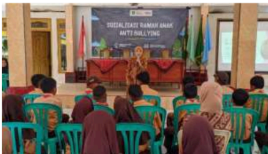
Gambar 10. Kegiatan Sosialisasi Ramah Anak Anti Bullying

mendapatkan respon yang baik. Guru mendampingi siswa disaat kegiatan sosialisasi berlangsung dan mendapatkan wawasan serta gambaran baru mengenai bullying . Guru menjadi sosok yang dapat dijadikan tempat curahan siswa ketika mengalami bullying di sekolah.