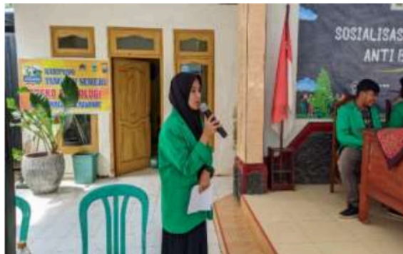
Gambar 5. Pembukaan Acara Sosialisasi Oleh Pembawa Acara