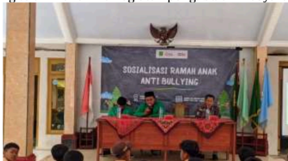
Gambar 7. Sambutan Ketua KKN-T 06 UNIRA Malang