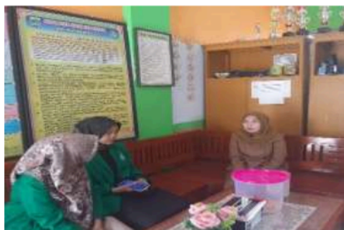
Gambar 2. Mahasiswa KKN-T 06 UNIRA Malang Sedang Melakukan Wawancara Studi Awal di SDN 02 Putukrejo

permasalahan belum terwujudnya profil pelajar Pancasila secara menyeluruh. Ditemukan kasus bullying yang mencerminkan bahwa belum memenuhi keterampilan pelajar Pancasila pada point berakhlak mulia. Studi awal disambut dengan baik oleh kepala sekolah sehingga mahasiswa KKN-T 06 UNIRA Malang diberikan kesempatan secara penuh untuk dapat bekerjasama dengan guru dalam mengatasi kasus bullying di SDN 02 Putukrejo Kalipare Malang.