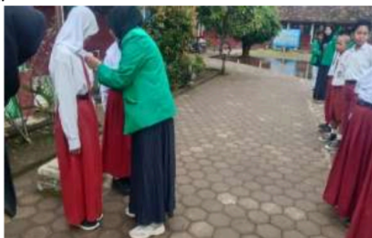
Gambar 11. Penyetaman Duta Anti Bullying

Kegiatan tindak lanjut yakni berupa observasi lanjutan pasca sosialisasi. Hal ini dilakukan guna mengetahui dampak adanya kegiatan sosialisasi bagi siswa dan pihak sekolah. Pada tahap tindak lanjut dilakukan observasi terhadap kemajuan siswa mengenai anti bullying . Siswa yang mampu memelopori teman-temannya dan mau mengingatkan sesama untuk tidak melakukan bullying diberikan hadiah sebagai bentuk penghargaan. Hadiah diberikan oleh mahasiswa KKN-T kelompok 06 UNIRA Malang dan menyematkan tanda duta anti bullying .