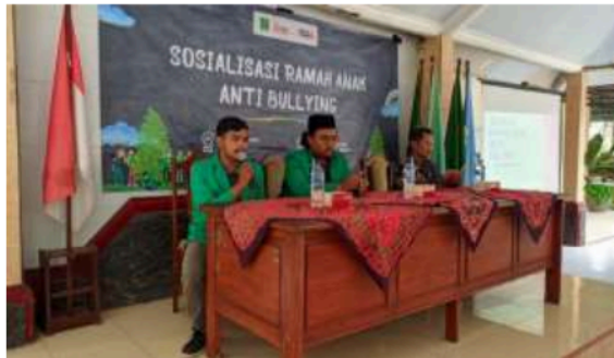
Gambar 8. Ketua Pelaksana Sosialisasi Menyampaikan Sambutan