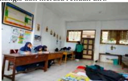
Gambar 3. Suasana ketika mahasiswa KKN-T 06 UNIRA Malang melakukan penggalan data bullyin di SDN 02 Putukrejo

Kegiatan observasi dilakukan mahasiswa KKN-T 06 UNIRA Malang dengan cara mereka diberikan kesempatan untuk mengajar disekolah. Proses kegiatan observasi sejak tanggal 14 Januari 2023 hingga 18 Januari 2023. Sebagai upaya penggalan data bullying yang terjadi di sekolah tersebut maka mahasiswa melakukan kegiatan belajar mengajar di kelas. Mahasiswa yang ikut dalam kegiatan pengabdian masyarakat ini memiliki latar belakang pendidikan khususnya Pendidikan Guru Sekolah Dasar (PGSD) dan Pendidikan Agama Islam (PAI). Pada tahap observasi ditemukan bahwa kasus bullying yang terjadi dalam bentuk verbal bukan fisik. Bullying yang terjadi yakni mengolok-olok teman, memanggil dengan nama orang tua, memanggil dengan nama lain seperti botak, kriwul, dan bahkan menyebut temannya dengan julukan si gendhut dan si kecil. Hasil observasi ditemukan akibat adanya bullying verbal siswa menjadi murung, menangis dan merasa rendah diri.