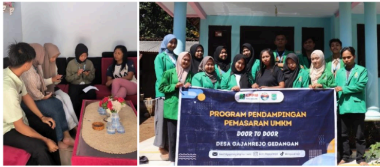
Gambar 3 Pendampingan Pada UMKM Kripik Sinarmas Krajan pembuatan E-commerce Shopee dan Gomaps Lokasi

Pelaksanaan pendampingan UMKM secara Door To Door di Desa Gajahrejo ini juga memberikan pemahaman bagi UMKM mengenai pentingnya tujuan, manfaat dan mekanisme terkait pemasaran digital serta legalitas usaha. Pemberian pemahaman mengenai pembuatan e-commerce usaha dan legalitas sertifikat produk halal terhadap UMKM karena masih banyak yang belum mengerti mengenai hal tersebut. Izin legalitas dan kehalalan produk usaha menjadi hal yang sangat penting bagi banyaknya persyaratan yang wajib dilakukan seorang pelaku usaha dalam berwirausaha dengan baik dan aman. Legalitas adalah poin utama bagi seorang wirausaha karena sebagai jati diri yang mengesahkan dan melegalkan suatu usaha sehingga dapat diakui masyarakat luas dan sah di mata hukum (Rudy Widyatama et al., 2023), Hal ini disebabkan oleh kurangnya pengetahuan, kekhawatiran akan biaya yang tinggi, keyakinan bahwa hal tersebut tidak penting dan rumit, serta ketidaktahuan tentang cara menanganinya. Oleh karena itu, program ini dilaksanakan untuk mengoptimalkan pelaku UMKM di desa Gajahrejo.