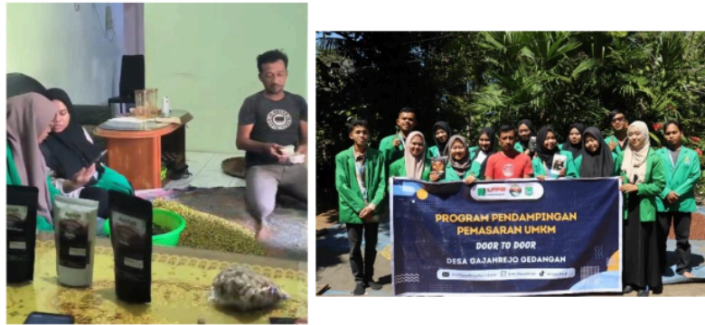
Gambar 4 Pendampingan UMKM Kopi Nangurad dengan Pembuatan E-commerce Shopee, lokasi Gomaps dan Sertifikat Halal

Pada pendampingan UMKM di Kopi Nangurad dilakukannya juga Pendaftaran akun e-commerce shopee dan Lokasi Gomaps yang dilakukan dengan menggunakan handphone pelaku UMKM serta penerbitan Sertifikat Halal dengan dibantu oleh Lembaga Sertifikasi Halal UNIRA Malang. Langkah yang dilakukan dalam pembuatan sertifikat halal yaitu berkas-berkas seperti NPWP, NIB serta data diri pelaku UMKM.