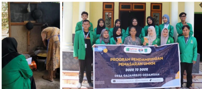
Gambar 6 Pendampingan UMKM Kripik Bungajaya dengan pembuatan Sertifikat Halal