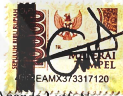
Ananda Lutfi Nurmansyah

Malang, 14 Mei 2025 Yang membuat pernyataan,