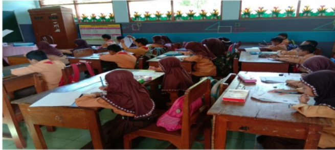
Gambar 1. Mengerjakan soal pre-test

Hasil perhitungan soal pre-test dan post-test pada kelas eksperimen dan kelas kontrol kemudian dibandingkan dan memperoleh hasil perhitungan tabel pre-test diatas menunjukkan t_{hitung} sebesar 0,725 dan t_{tabel} 0,206 maka t_{hitung} \geq t_{tabel} kesimpulannya H_0 diterima dan H_a ditolak. Artinya tidak ada pengaruh pada penggunaan media realia terhadap hasil belajar. Sedangkan pada tabel post-test diatas menunjukkan t_{hitung} sebesar 0,000 dan t_{tabel} 0,206 maka t_{hitung} < t_{tabel} kesimpulannya H_0 ditolak dan H_a diterima. Artinya ada pengaruh penggunaan media realia terhadap hasil belajar yang memiliki tingkat signifikansi 5% dengan presentase hasil belajar 13.8 atau 19%.