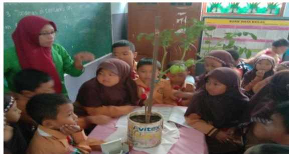
Gambar 4. Pembelajaran dengan menggunakan media realia

Pada kelas eksperimen menggunakan benda nyata (pohon tomat) dalam proses pembelajaran, guru mengajak siswa mengamati secara langsung dan mendiskusikan dengan teman serta menyimpulkannya. Pengalaman belajar yang diperoleh siswa adalah siswa mampu mengamati dan mudah memahami materi yang telah diajarkan untuk mencapai tujuan pembelajaran yang telah ditentukan.