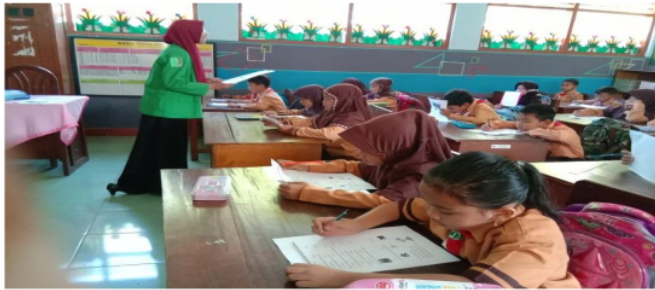
Gambar 2. Mengerjakan soal pos-test