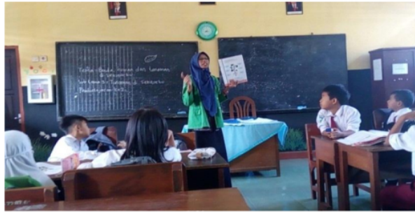
Gambar 5. Pembelajaran dengan menggunakan buku tema

Pembelajaran dikatakan efektif apabila di dalam pembelajaran siswa berinteraksi dan berkerja sama antara guru dengan siswa, siswa dengan siswa lainnya dengan menggunakan media. Penelitian ini bertujuan untuk mengetahui apakah ada pengaruh penggunaan media realia terhadap hasil belajar dan seberapa besar pengaruh tersebut pada pembelajaran tematik kelas 1 SDN 01 Kemantren.