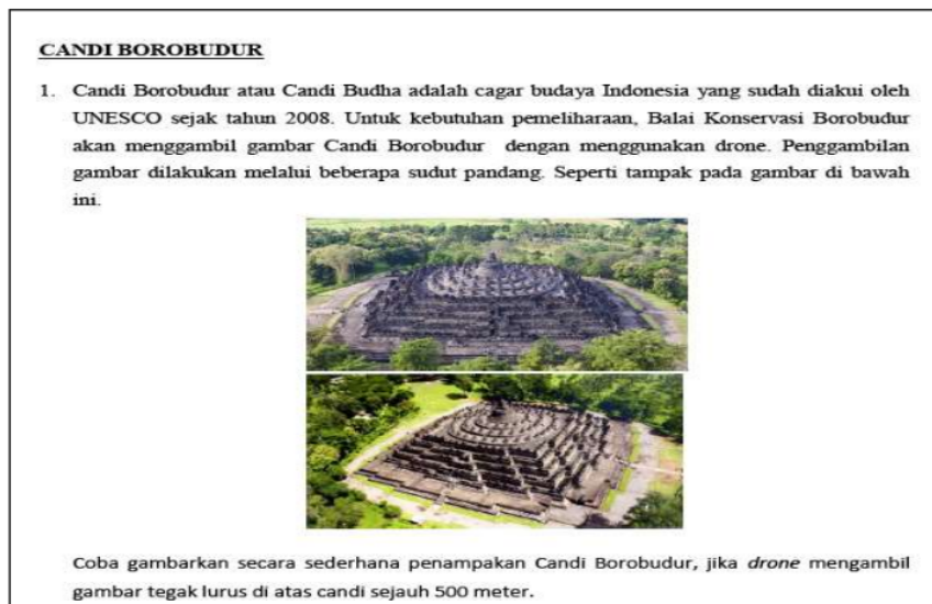
Gambar 1. Soal Sebelum Revisi

Prototype 1 divalidasi oleh validator yang ahli dibidang matematika dan oleh guru mitra. Tim validator memeriksa konten, konteks, dan bahasa pada soal. Setelah itu, soal diberikan kepada siswa pada proses one-to-one . Berikut merupakan hasil revisi soal dan proses one-to-one sebelum dan sesudah revisi.