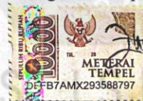
Siti Zubaidah Pude