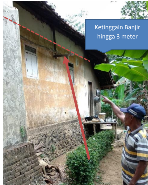
Gambar 2. Penampang Topografi Desa Sitarjo (Suara Geologi, diakses 2018)

Banjir bandang 2003 cukup parah karena di tahun-tahun sebelumnya terjadi deforestasi hutan secara besar-besaran di wilayah Malang Selatan. Setelah itu, kejadian 2007 dan 2010 tidaklah terlalu besar lantaran proses peremajaan hutan sudah mulai berjalan. Dampak perubahan iklim mulai dirasakan dengan banjir bandang parah pada 2013, dan hampir terulang pada 2017. Bahkan menurut warga Dusun Rowoterate, ketinggian air banjir mencapai 3 meter (Gambar 2).