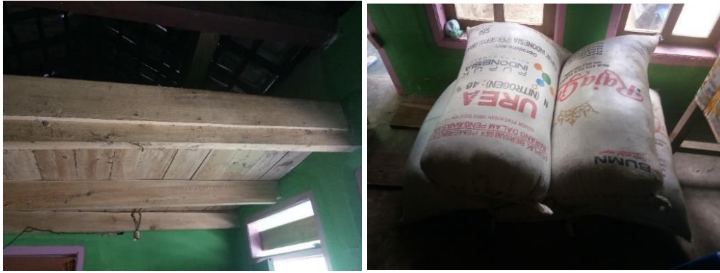
Gambar 5. Plenggrongan di Langit-Langit Rumah (a) dan Cadangan Makanan di simpan di Plenggrongan (b) (Dokumentasi peneliti, 2019)