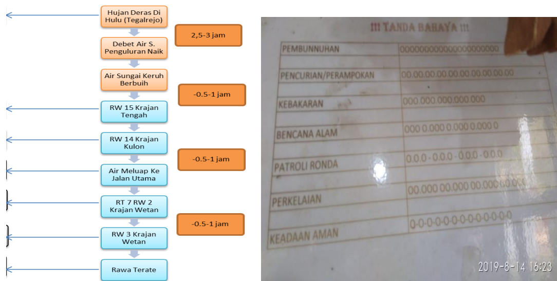
Gambar 3. Desain Sistem Peringatan Dini Banjir Bandang Sitarjo (a), dan Kode Bunyi Titir untuk Bencana Alam (b) (Dokumentasi peneliti, 2019)

Bentuk penyebaran informasi dari rantai peringatan tersebut dilakukan dengan menyiagakan warga yang paling dekat dengan sungai, setiap ada perubahan ketinggian air sungai, petugas yang berjaga mengirim pesan berantai di wilayah yang lain (Gambar 3). Pesan disampaikan melalui sms handphone , handitalky , juga titir kentongan . Titir adalah ritme memukul kentongan secara terus-menerus, cepat tanpa jeda dengan tujuan semua masyarakat dapat mendengar dan merespon dengan segera. Respon masyarakat dilakukan dengan berbagai cara, penyelamatan ternak, penyelamatan harta benda, hingga penyelamatan diri.