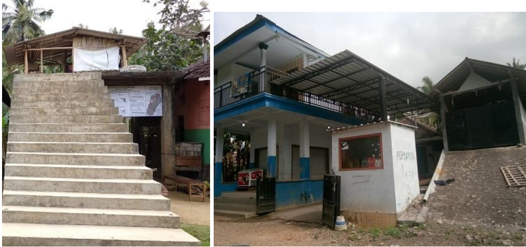
Gambar 4. Tempat evakuasi komunal (a) dan salah satu rumah warga yang didesain dua lantai, termasuk garasi rumah (b)

Beberapa warga lebih memilih tinggal di rumah masing-masing, yang sengaja memang telah ditinggikan rumahnya. Namun beberapa warga mengevakuasi diri ke tempat evakuasi komunal. Tempat evakuasi ini berada di Dusun Rowotrerate yang dibangun atas swadaya masyarakat di atas tanah hibah seorang warga. Dengan kapasitas 30-50 orang, tempat evakuasi ini dapat memfasilitasi warga yang rumahnya terendam hingga sampai atap saat banjir (Gambar 4).