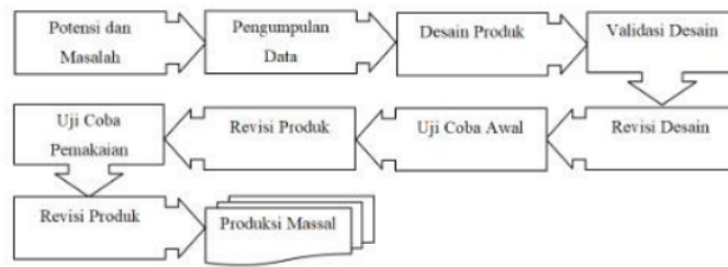
Gambar 1. Langkah Metode Research and Development (Sugiyono, 2017)

Uji coba produk dalam penelitian ini yaitu desain uji coba lapangan utama menggunakan rancangan desain pre-experimental design yaitu one-group pretest-posttest design , rancangan tersebut dapat dilihat pada Gambar 2.