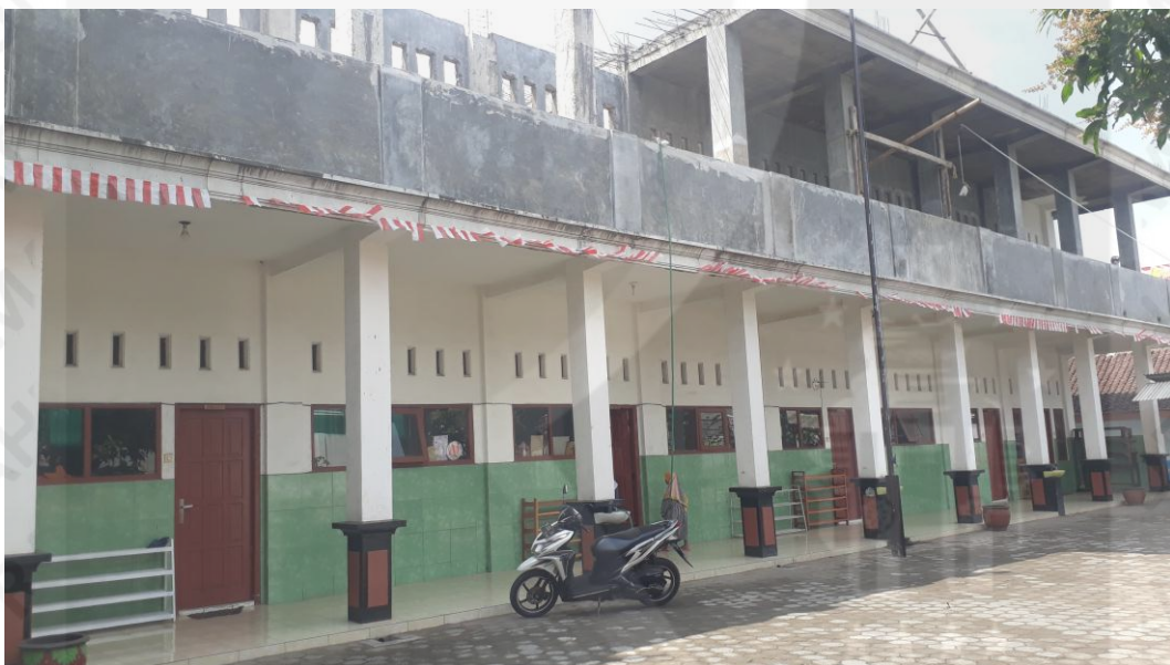
Gedung sekolah dalam tahap pembanguana