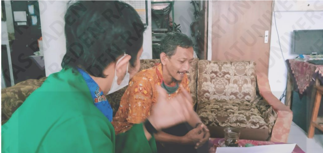
Melakukan wawancara validasi sistem kepada Kepala Sekolah