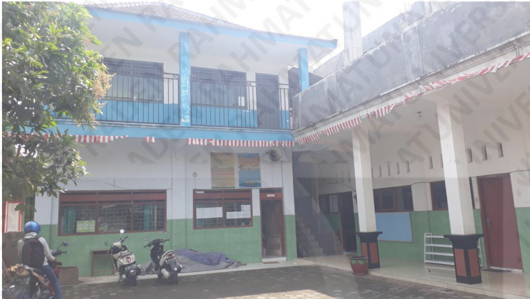
Lokasi penelitian di SMPI Lukman Hakim Pakisaji