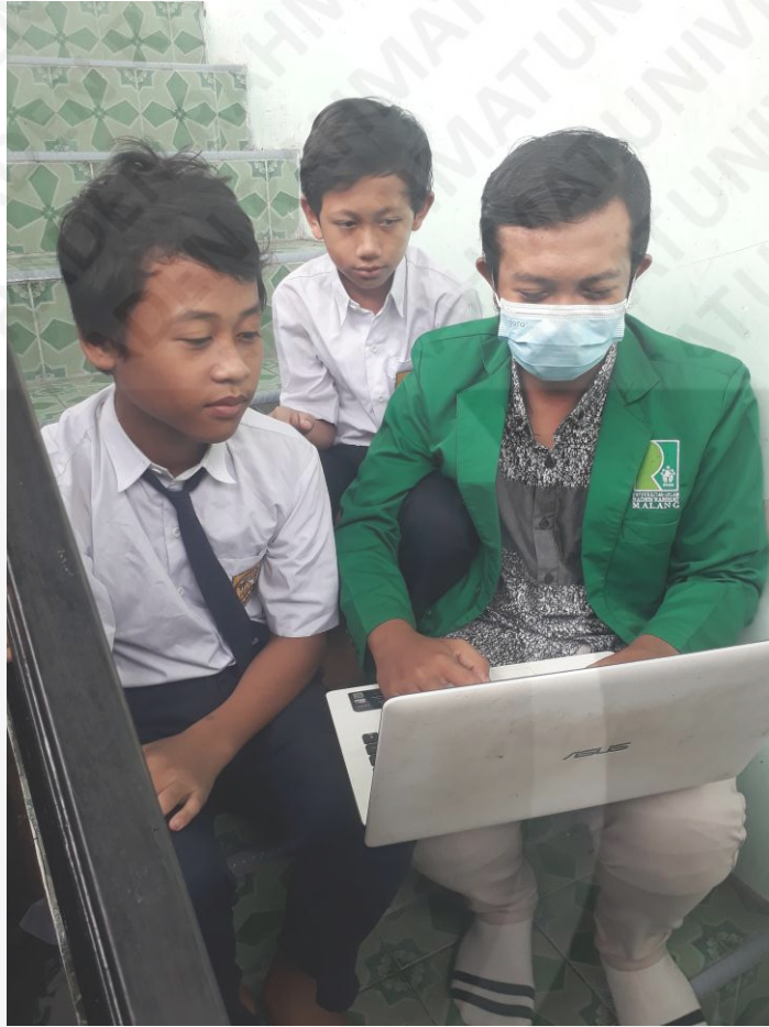
Melakukan wawancara validasi sistem kepada Siswa