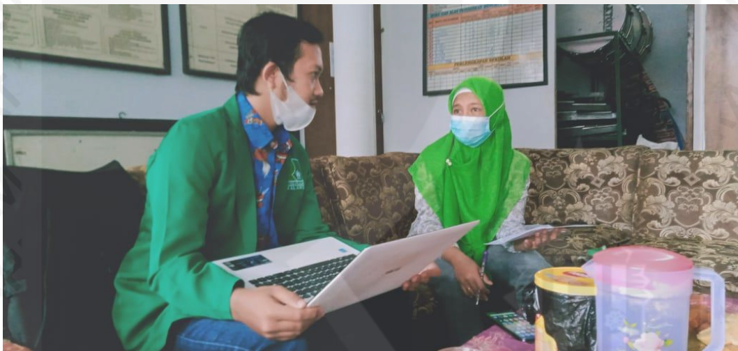
Melakukan wawancara validasi sistem kepada Bendahara