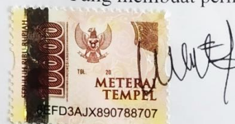
Wiwik Lailatul Fadilah