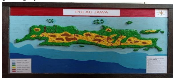
Gambar 2. Hasil media miniatur budaya

Hasil pengembangan produk awal terdiri dari 4 tahapan, yaitu (1) Pengumpulan informasi: berdasarkan observasi dan wawancara terhadap guru kelas IV SDN 3 Kemantren diperoleh data bahwa media pembelajaran yang digunakan sangatlah terbatas dan kurang bervariasi. Begitu juga dengan hasil belajar siswa yang mana lebih dari 40% peserta didik memperoleh nilai dibawah KKM (75). (2) Perencanaan: perencanaan pembuatan media miniatur budaya dilakukan berdasarkan kompetensi dasar dan indikator yang telah ditentukan berdasarkan karakteristik siswa. (3) Pengembangan produk awal: pembuatan produk diawali dengan menyiapkan alat dan bahan seperti triplek, list kayu, kertas bekas, lemputih, sedotan bening, batang cottoned, cat kayu tinner, gergaji, pensil, penggarid dan lain sebagainya. Kemudian dilanjutkan dengan membuat pola, membuat adonan kertas, pembuatan miniatur pulau, pewarnaan daratan dan lautan, pembuatan kartu budaya. Berikut hasil pengembangan produk awal.