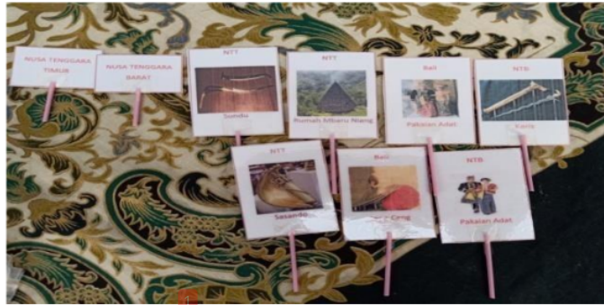
Gambar 3. Kartu budaya

(4) Validasi ahli media dilakukan oleh Bapak Andi Wibowo M.Pd. Validasi ahli media memperoleh jumlah skor 38 dengan rata-rata 3,45 yang memperoleh kategori “Sangat Baik”. Validasi ahli materi dilakukan oleh Bapak Riono, S.Pd.SD dengan jumlah skor 32 dengan rata-rata 3,20 yang memperoleh kategori “Baik”. Angket siswa diberikan kepada siswa kelas IV A SDN 3 Kemantren dengan hasil skor rata-rata 3,90 dengan kategori “Sangat Baik”. Hasil validasi media ini sesuai dengan salah satu pernyataan Asyhar (2012: 82) yaitu media harus memperhatikan keterjangkauan pembiayaan, baik pembuatan, pengadaan, maupun perawatannya.